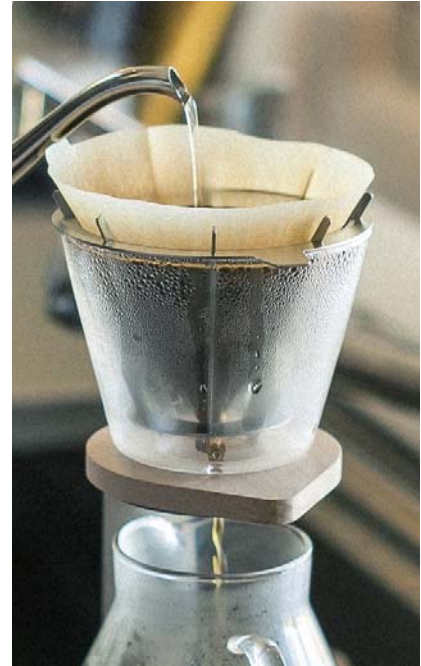
※バートドリッパー

コーヒーの楽しみ方が多様化し、安くて美味しいコーヒーが日常的に飲める一方で、スペシャルティコーヒーやシングルオリジンという言葉も珍しくなくなってきており、豆本来のフレーバーを楽しむような高級志向が伺えます。休日や一日の特別な時間にコーヒーを淹れる、家族やパートナーとゆっくり過ごすため、あるいは自分と向き合うため、コーヒーを淹れることそのものを大切にする、そんなシーンが想像できます。バートドリッパーは、その大切な時間に寄り添える佇まいと、淹れ手が自由に抽出を楽しむ機能性をあわせ持った特別なドリッパーです。